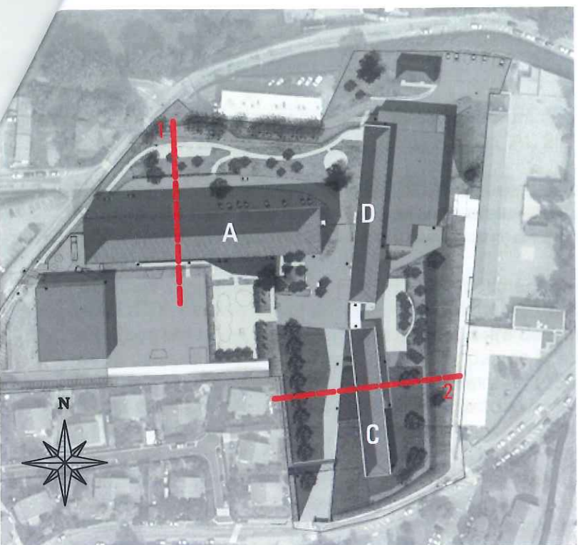
situation des coupes